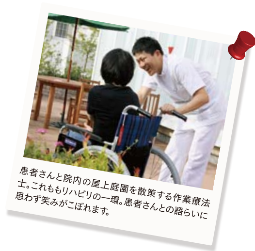
患者さんと院内の屋上庭園を散歩する作業療法士。これもリハビリの一環。患者さんとの話らしいに思わず笑みがこぼれます。

「私たちは患者さんの気持ちに寄り添った看護やリハビリを実践しています。ご自宅へ戻られる時、患者さんやご家族の方に“ありがとう”と言っていた