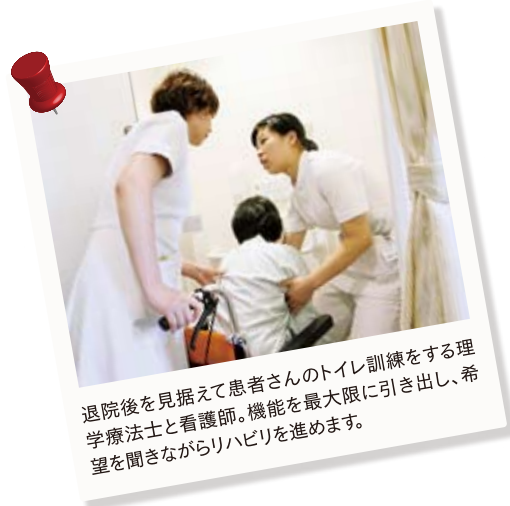
退院後を見据えて患者さんのトイレ訓練をする理学療法士と看護師。機能を最大限に引き出し、希望を聞きながらリハビリを進めます。