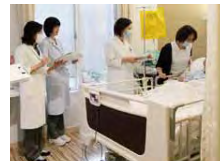
病室を回るラウンドの時間。患者さんの意見を直接聞くことのできる貴重な場となっています。

美味しく食べていただくためには、患者さんの意見や摂取状況などのスタッフ間の情報交換が欠かせません。食事は基本的医療の一つでありながら、患者さんにとっていかに楽しい時間となるかがカギとなります。そのため、スタッフにとって患者さんの「美味しい」という言葉が何よりの喜びなのです。