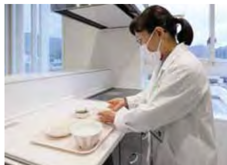
食事は治療の一環。管理栄養士は安全で安心して食べていただける食事の提供を心がけています。