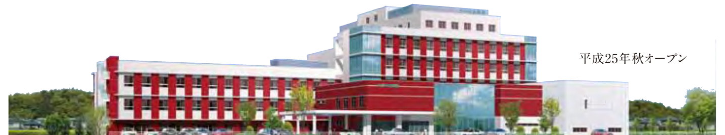
平成25年秋オープン

新病院全館オープンに向けてスタッフも希望を大きく膨らませています。本年もどうぞよろしくお願ひいたします。