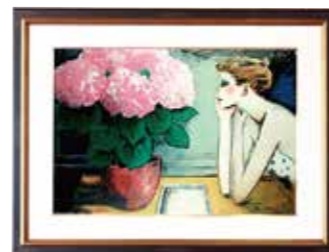
『紫陽花』 カシニール作