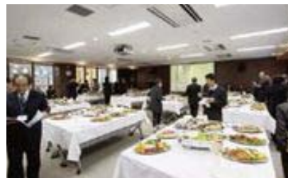
第一研修室にて軽食と談話