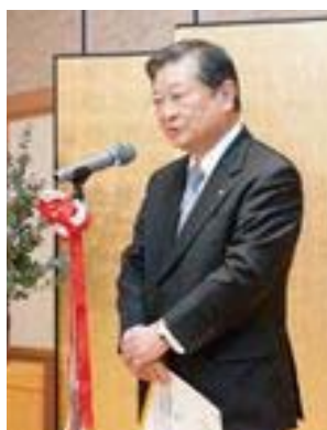
伊予銀行 森田会長挨拶