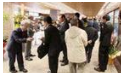
多数のご来場を頂きました