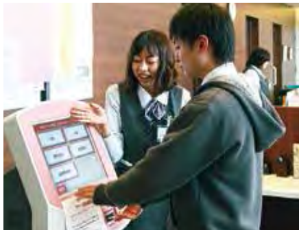
再診予約の受付が簡単に

患者さんのカルテがサッと表示されるので、準備に時間がかからなくなり、各診療科へ速く届くようになりました。現在、患者さんには受診票を持って動いていただくという“ひと手間”をお願いしていますが、「今までは本当に受付されたのか、会計にカルテが届いているのか不安だったが、自分で持って行くので安心だ」というご意見も頂戴す