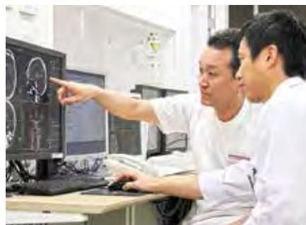
画像を見ながら治療方針を検討

今回の電子カルテは、医師が指示を入力すると直接検査科、放射線科に届くので、複数の端末から情報が確認でき、進行状況により微調整が可能となりました。検査結果の参照も迅速で、採血の結果も検体提出後30分以内には外来で確認でき、また、CT検査などは撮影が終了し、