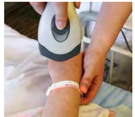
リストバンドでお名前を確認

ることができるので、処置も早く行うことができます。注射を行う際には、リストバンドのバーコードを読み取ることで、患者さんの確認ができ、更に安全性が高まりました。