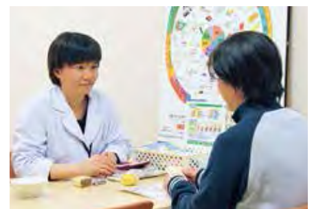
個別での食事指導

医師が入力した食事指示が直接栄養科に届くので、準備に早く取りかかると共に、指示の漏れが無くなりました。また、情報の一元化により、患者さんのアレルギーや病状が速やかに把握でき